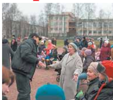
День матери отметили в Пионерском парке, стр. 3