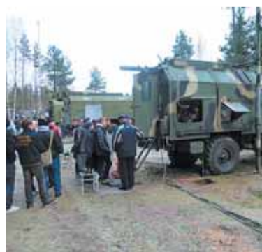
День призывника, стр. 6