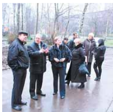
Объезд по средам, стр. 2