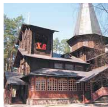
Экскурсия, стр. 9