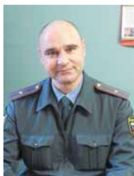
Ваш участковый, стр. 4